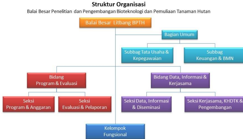
Gambar 1. Struktur Organisasi BBPPBPTH

Struktur Organisasi BBPPBPTH seperti pada Gambar 1 di bawah.