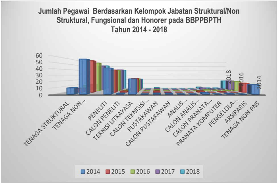
Grafik 2. Pegawai Berdasarkan Kelompok Jabatan Struktural/Non Struktural, Fungsional dan Honorer pada BBPPBPTH Tahun 2014 - 2018